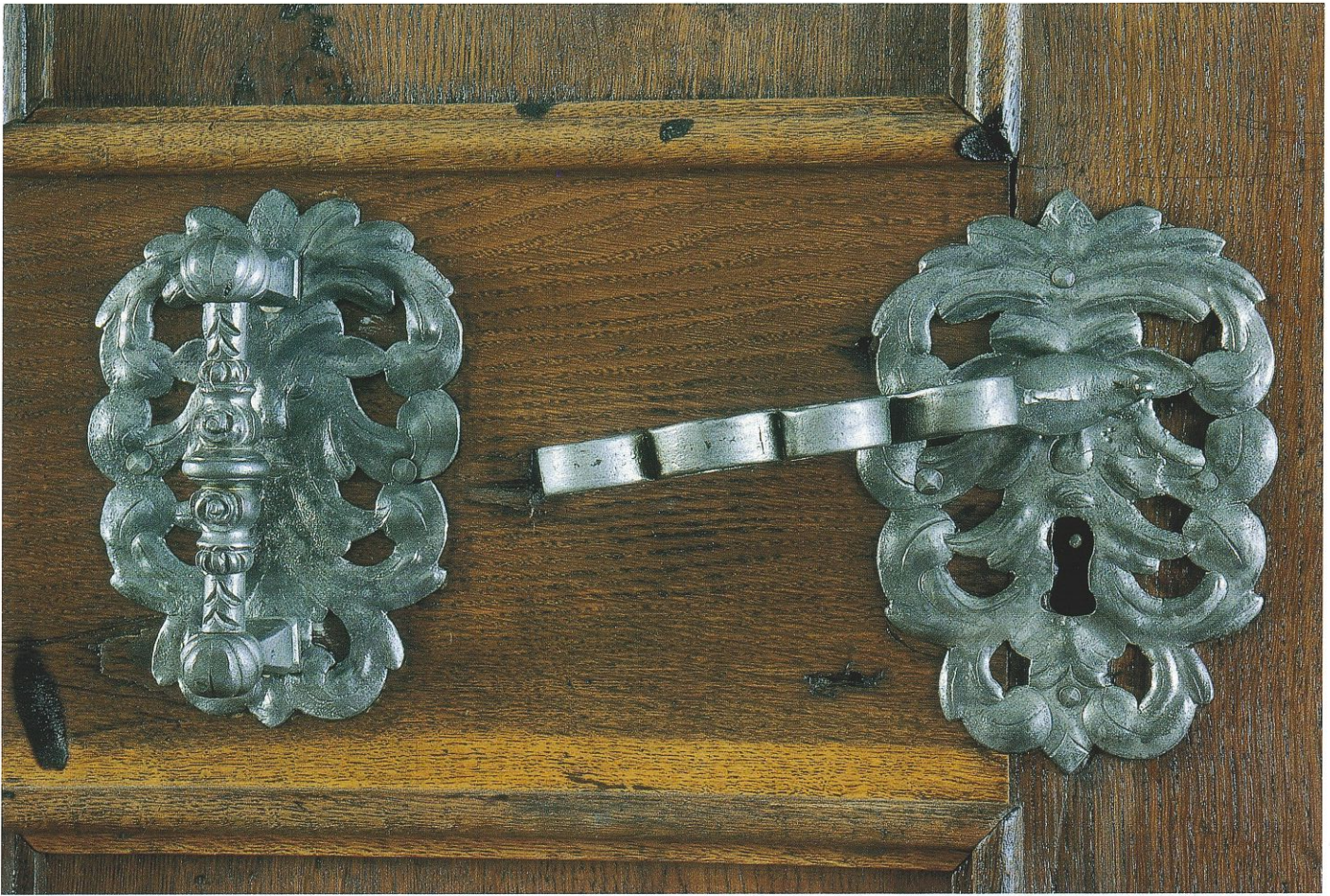
Abb. 95: Türgriff und Schlüsselblech an einer der Kirchentüren nach Restaurierung.