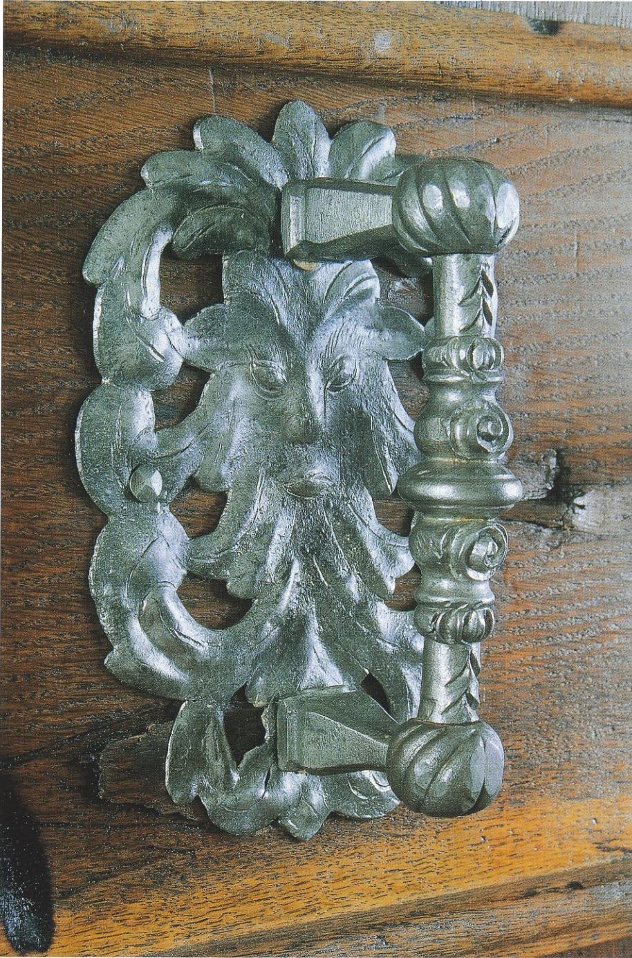
Abb. 99 (links): Maria Kirchentel, Wallfahrtskirche. Einer der vorbildlich gearbeiteten Türgriffe nach Restaurierung.