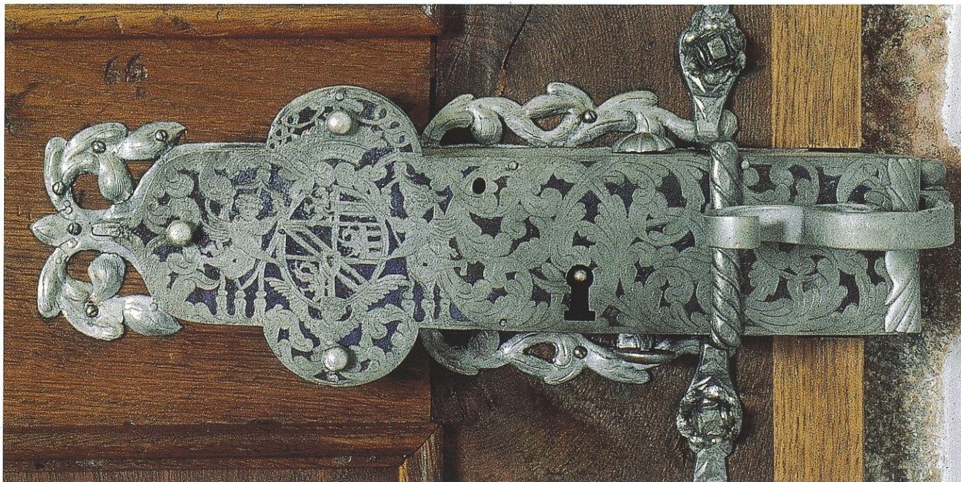
Abb. 96 (links oben): Maria Kirchentel, Wallfahrtskirche. Eines der Türschlösser (mit farbig überstrichenem Schloßkasten) vor der Restaurierung.